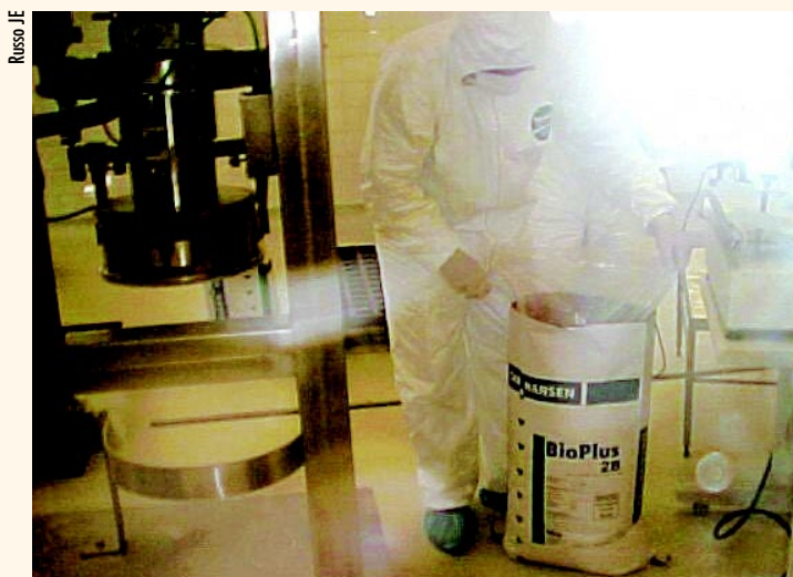
O Bio Plus 2B, produzido pela CHR Hansen, é o primeiro probiótico aprovado pela União Européia para uso em ração animal

do disfunções fisiológicas. Assim, a colonização do meio por microorganismos probióticos diminuiria a presença de bactérias patogênicas. Para ter atuação intestinal, o probiótico deve ser resistente ao fluido ruminal, ácido clorídrico (estômago verdadeiro), e sais biliares. Além de exercer efeito benéfico ao hospedeiro, o microorganismo probiótico deve ter capacidade de aderir ao epitélio intestinal, não